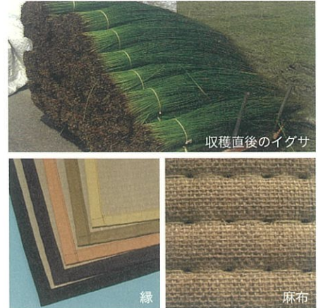
収穫直後のイグサ