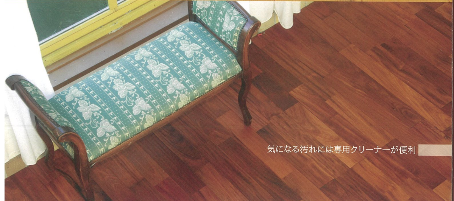
気になる汚れには専用クリーナーが便利