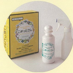
ハウスクリーナー「こめっとさん」