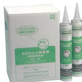
ゼロホルム接着剤

厚生労働省が揮発性有機化合物室内濃度指針値(案)を示した物質を原料として使用していません。(ホルムアルデヒド、トルエン、キシレン、パラニクロロベンゼン、エチルベンゼン、スチレン、クロルピリホス、フタル酸ジ-n-ブチル、テトラデカン、フタル酸ジ-2-エチルヘキシル、ダイアジノン、アセトアルデヒド、フェノブカルブ、ノナナール)