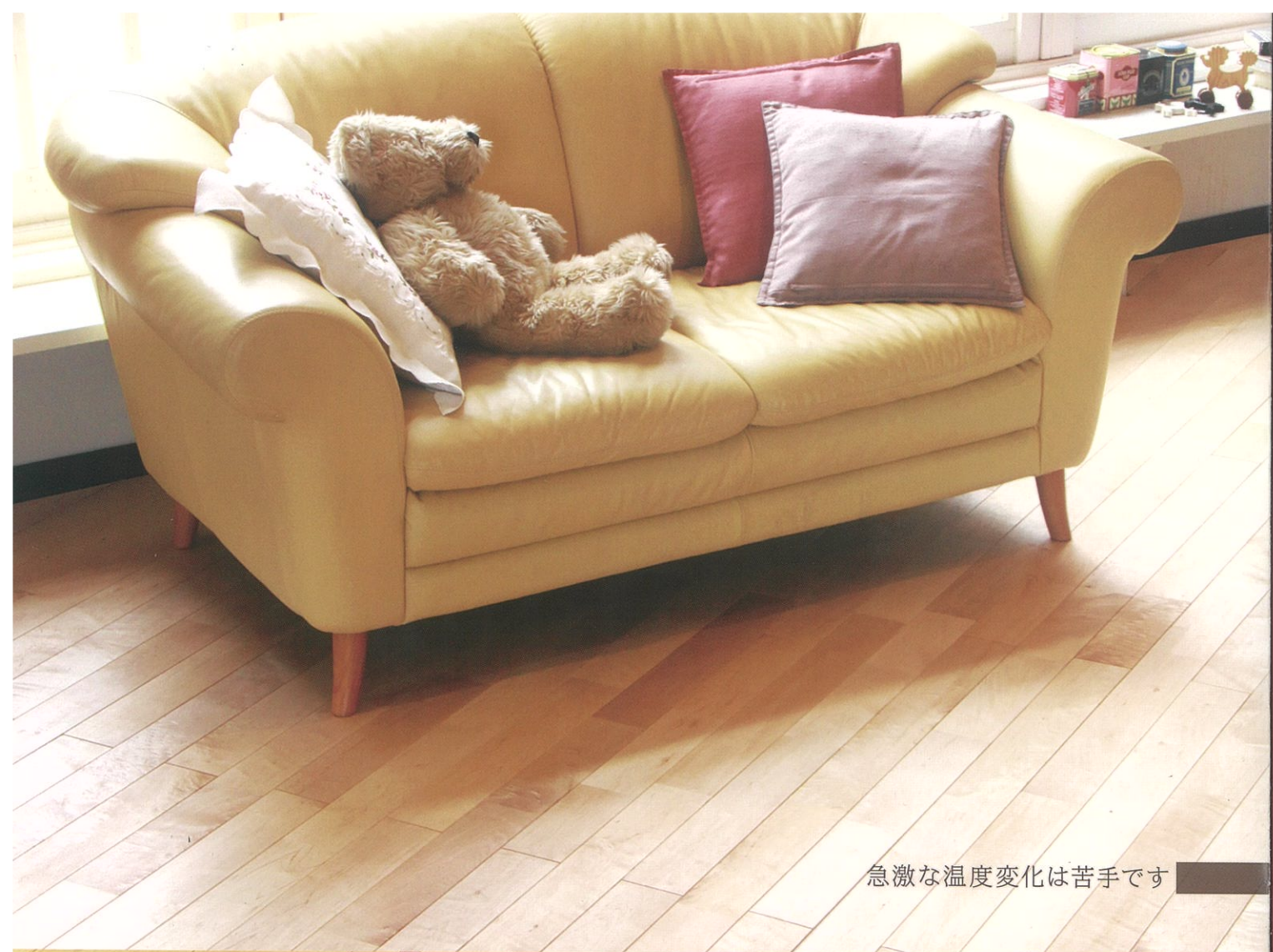
急激な温度変化は苦手です