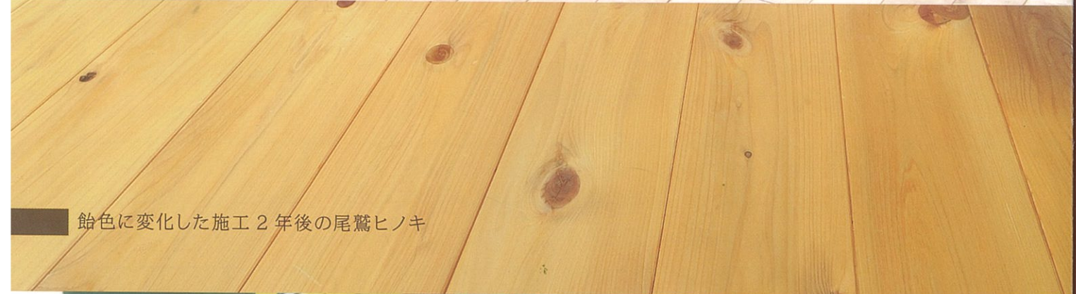
飴色に変化した施工2年後の尾鷲ヒノキ